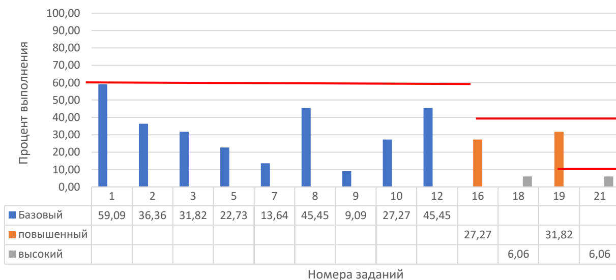
Рисунок 2. Задания, по которым участники не преодолели минимальный порог

Анализ результатов участников и типов заданий, попавших в перечень (табл. 2, рис. 2), выявил следующие частые затруднения участников экзамена: